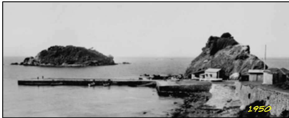
LE PORT DE TIGZIRT VERS 1950 - AVEC LA CABANE DUPUIS ET CELLE DES PÊCHEURS AU PIED DE LA PRESQU'ÎLE