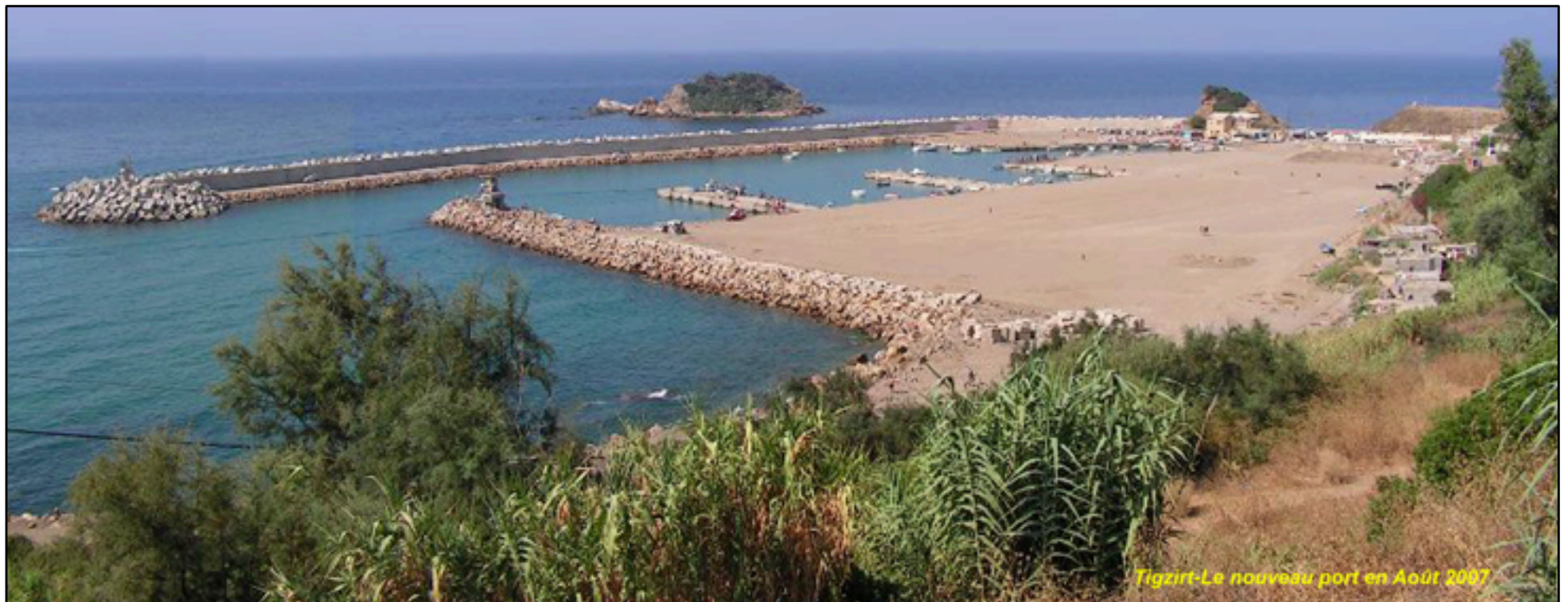
LE SITE CARACTÉRISTIQUE DE TIGZIRT N'EST PLUS QU'UN SOUVENIR : À LA PLACE, LE NOUVEAU PORT DE PLAISANCE DE TIGZIRT EN 2008 , HÉLAS ...