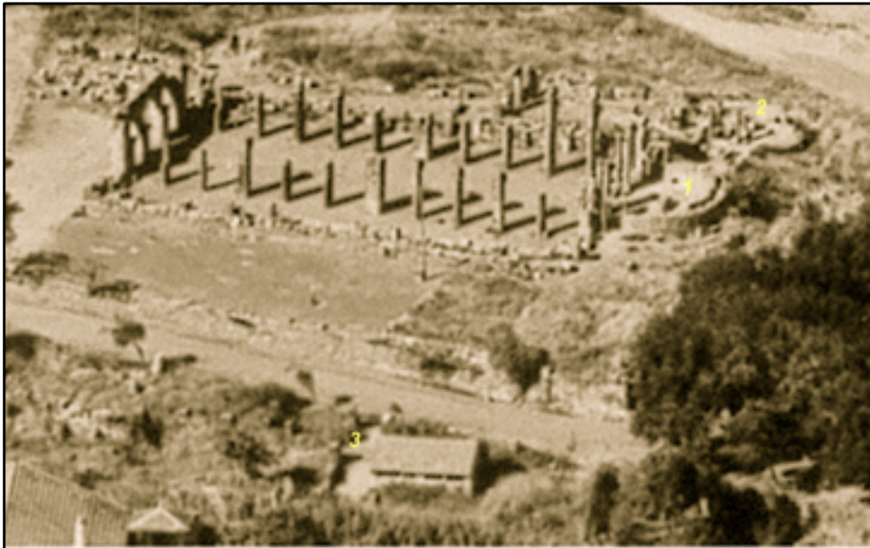
Tizirt - La basilique du V e siècle après JC vue du ciel 1 - l'autel - 2 le baptistère - 3 les thermes (sous la cabane : une mosaïque)